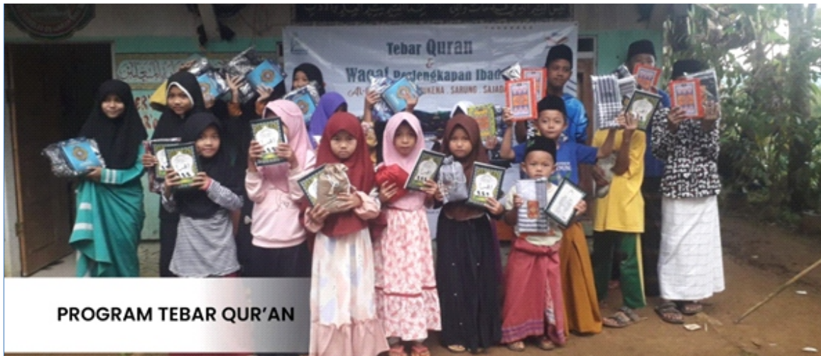
PROGRAM TEBAR QUR'AN

Tebar Qur'an adalah kegiatan pemberian wakaf berupa distribusi Al Qur'an dan perlengkapan ibadah untuk mushola, madrasah dan masjid yang membutuhkan, berhak dan memenuhi persyaratan baik di kota Bandung maupun dalam lingkup Jawa Barat.