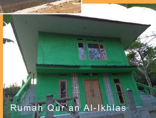
Rumah Qur'an Al-Ikhlas